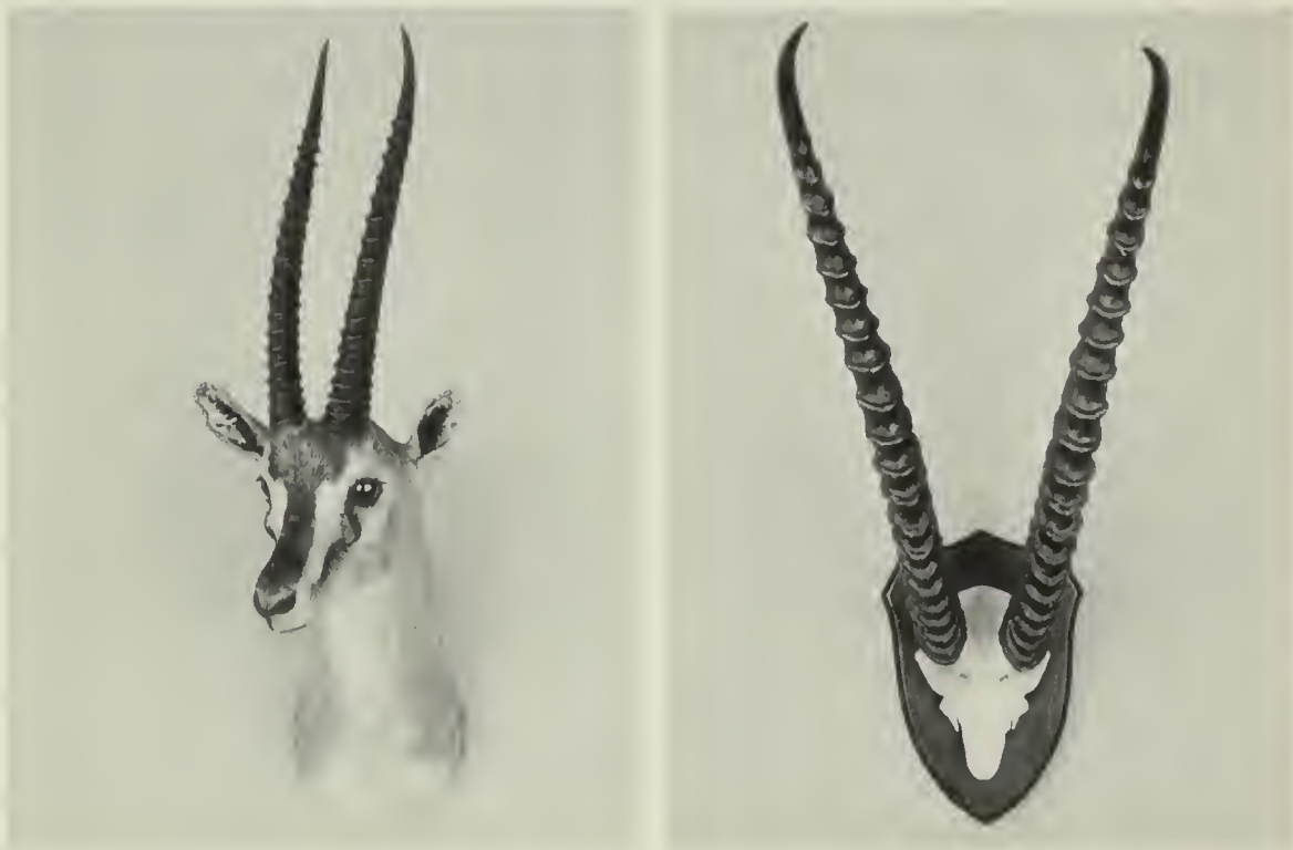
A sinistra: Gazzella di Thomson ( Gazella thomsoni Günther, 1844); a destra: Gazzella di Grant settentrionale ( Gazella granti raineyi Heller, 1913).

Kobus leche Gray, 1850 - Lichi - Lechwe: una testa di maschio adulto appartenente alla sottospecie nominale dall'Africa meridionale.